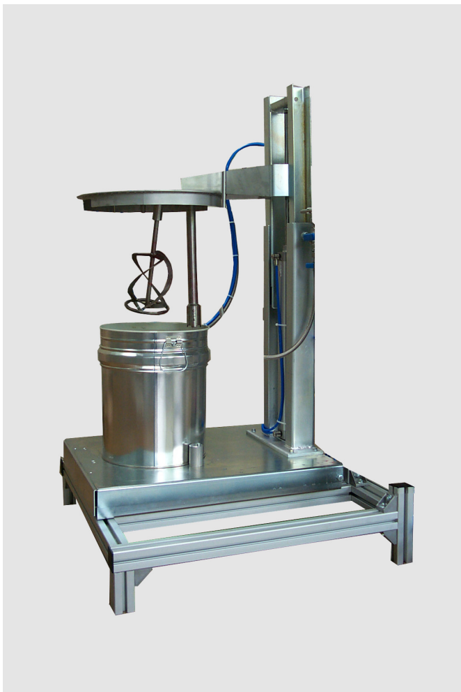
Füllstandsüberwachung mit angebautem Fassdeckelheber

Die von Reiter entwickelte Füllstandsüberwachung wurde konsequent an den Anforderungen der Anwender ausgerichtet. Das gravimetrische Meßsystem erfaßt den Füllstand der Behälter ohne direkt mit dem Medium in Kontakt