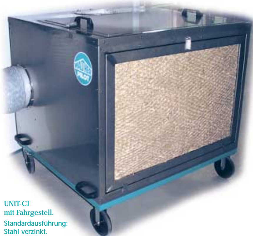
UNIT-CI mit Fahrgestell. Standardausführung: Stahl verzinkt. Option: Edelstahl-rostfrei.

Für die kleine Spritz- oder Schleifarbeit zwischendurch: der Absaugwürfel UNIT