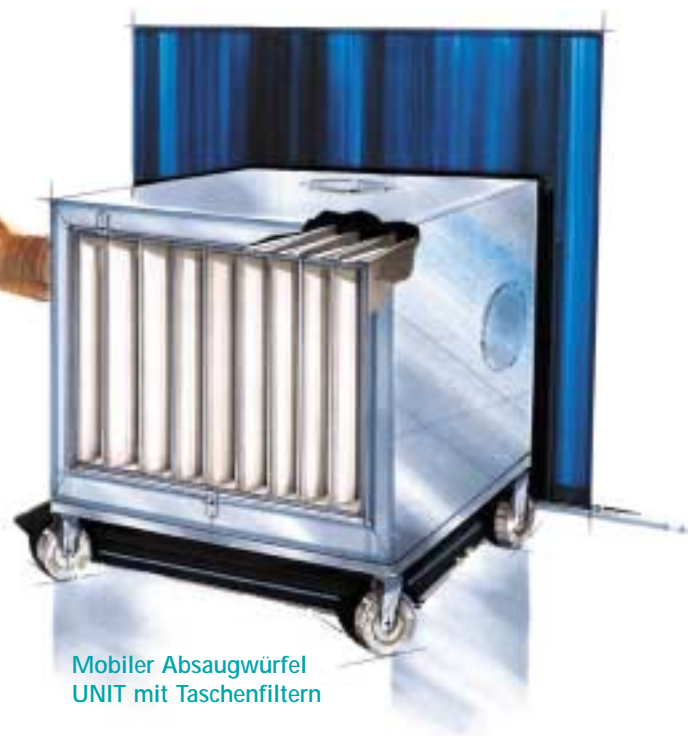
Mobiler Absaugwürfel UNIT mit Taschenfiltern

Die Umrüstung von einer bestehenden Version auf eine andere ist leicht für den Anwender durchführbar.