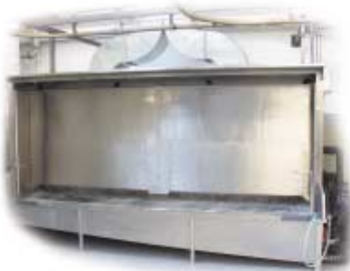
Wasserbeflutete Spritzwand Typ 6022

Darüber hinaus bietet WALTHER PILOT Ihnen kompetente Hilfe bei der Anlagenplanung. Vom Systemanbieter für Spritztechnik, Materialfördertechnik und Absaugtechnik beziehen Sie alle erforderlichen Komponenten aus einer Hand.