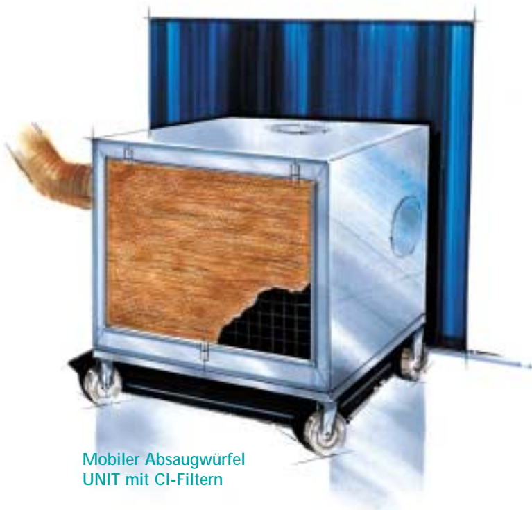
Mobiler Absaugwürfel UNIT mit CI-Filtern